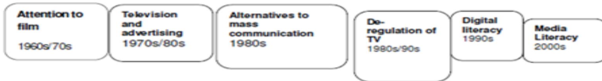
Figure 9. Table: Historical overview of information and communication technologies.